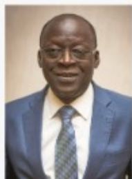
Abdoulaye BIO TCHANE Ministre d'Etat Chargé du Plan et du Développement