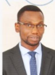
Benjamin B. HOUNKPATIN Ministre de la Santé