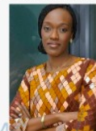
Sadia ASSOUMA Ministre de l'Industrie et du Commerce