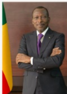
Patrice TALON Président de la République Chef de l'Etat Chef du Gouvernement