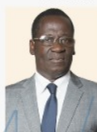
Alassane SEIDOU Ministre de la Décentralisation et de la Gouvernance Locale