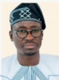
Jean Michel B. ABIMBOLA Ministre du Tourisme, de la Culture et des Arts