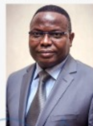
Hervé HÉHOMEY Ministre des Infrastructures et des Transports