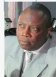
Alain OROUNLA Ministre de la Communication et de la Poste