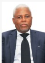
Séverin M. QUENUM Garde des Sceaux, Ministre de la Justice et de la Législation