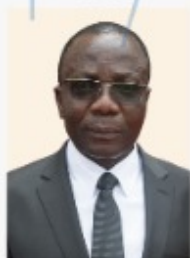
Mahougnon KAKPO Ministre des Enseignements Secondaire, Technique et de la Formation Professionnelle