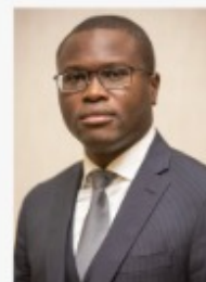
Romuald WADAGNI Ministre de l'Economie et des Finances