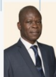
Fortunet Alain NOUATIN Ministre Délégué auprès du Président de la République Chargé de la Défense Nationale