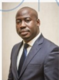
Oswald HOMÉKY Ministre des Sports