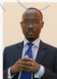
Modeste T. KÉRÉKOU Ministre des Petites et Moyennes Entreprises et de la Promotion de l'Emploi