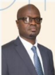
Samou Séidou ADAMBI Ministre de l'Eau et des Mines