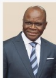
Aurélien AGBENONCI Ministre des Affaires Etrangères et de la Coopération