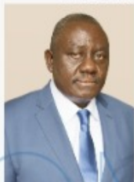
Gaston DOSSOUHOU Ministre de l'Agriculture, de l'Elevage et de la Pêche