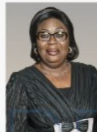
Adidjatou MATHYS Ministre du Travail et de la Fonction Publique