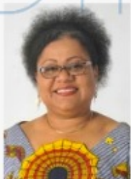
Véronique TOGNIFODE Ministre des Affaires Sociales et de la Micro Finance