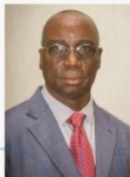
Sacca LAFIA Ministre de l'Intérieur et de la Sécurité Publique